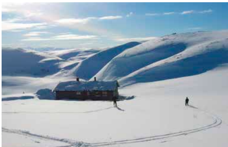
TVERRLIHYTTA: Med fiskemoglegheiter om sommaren, og skiterreng om vinteren. Fint for aktive barnefamiljar