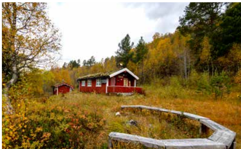
HERMANNHYTTA : Ligg som eit knutepunkt mellom Fjodruta og hyttane i Trollheimen. Fint bær-område.