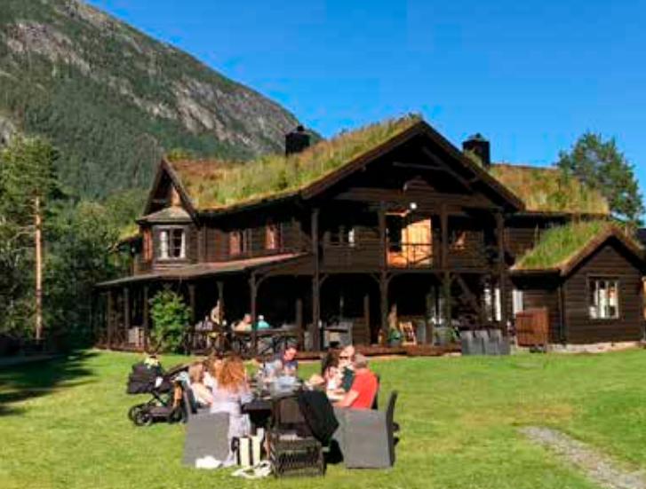
TODALSHYTTA - ei perle i Todalen, inngangsporten til Trollheimen. Historisk lodge ved lakse-elva Toa med gode turmoglegheiter. Betent i sesong.