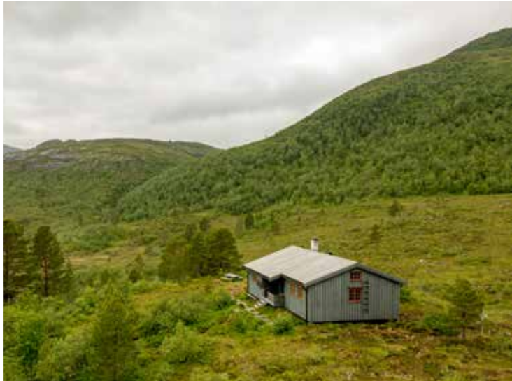
JUTULBU: Ligg på ei lita høgde sør for fjellet Tussan, Badeplass og fiskevatn i nærleiken.

I tillegg kan du lese om den sjølvbetente hytta på Kårvatn i Todalen på ut.no .