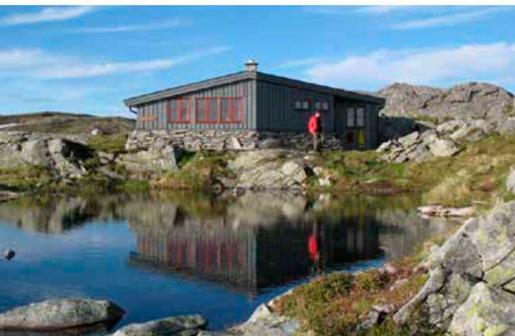
HARDBAKKHYTTA : Ligg ved eit lite tjern lett tilgjengeleg både frå Valsøybotn og frå Bøverdalen.

DNT-hyttene er i hovudsak sjølvbetente hytter, men Todalshytta i Todalen er ein av dei betente hyttene Kristiansund og Nordmøre Turistforening (KNT) har.