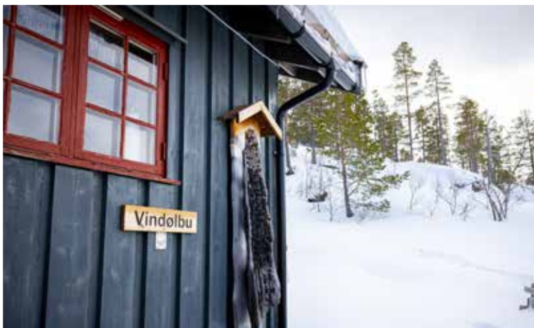
VINDØLBU: Eit flott utgangspunkt for dagsturar frå Vindøladalen, nordvest i Trollheimen.