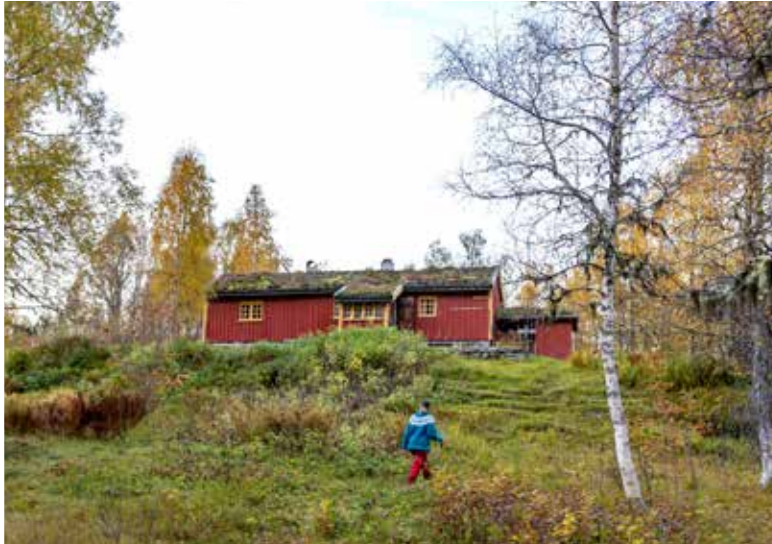
SÆTERSETRA: Ligg oppe i sørsida av Surnadalsfjoret. Bindeledd mellom Fjorderuta og Trollheimen.