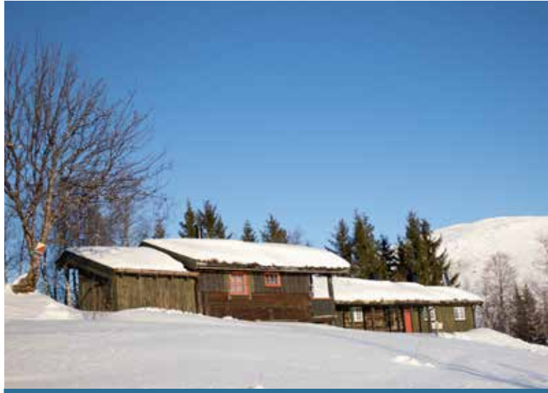
GRYTBAKKSETRA : Trivelege seterhus i barnevennlige omgivnader ved ei flott elv med fossar og kulpar.