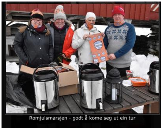
Romjulsmarsjen - godt å kome seg ut ein tur

Elles har Todalen IL hatt fleire turmål gjennom Nordmøre og Romsdal friluftsråd si StikkUt! satsning. Både Tjønnyra og Toåa Tursti er registrert som sommar- og vinterturar.