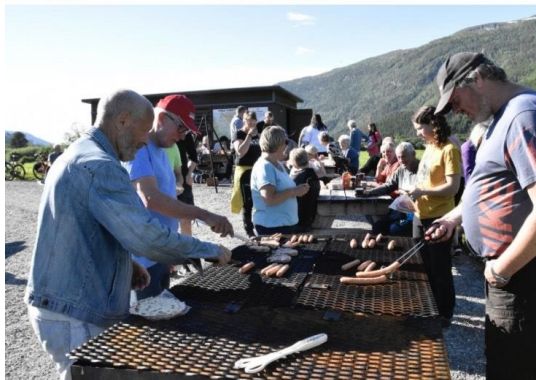
Grillkos – Trimgruppa fyrte opp storgrillen og det var mange som hiva grillmat bortpå grillen etter kvart.

Den dagen vart folk invitert til grilling i Båthølen. Alle vart oppmoda om å ta med eigen grillmat, medan Trimgruppa sørger for kaffe og saft. Folk tok oss på ordet og møtte i hopetal. Om det er det fine veret som var eller Trimgruppas sjarmer vites ikkje. Uansett kva årsaken var, såg det ut til at alle kosa seg stort.