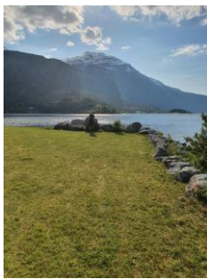
Dugnad på badeplassen.

Som tidlegare nemnt, så vart aktiviteten i 2020 redusert som følgje av koronasituasjonen. Følgjande aktivitetar er gjennomført i 2020: