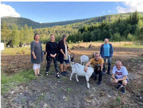
Nytt og gammalt styre.

Det gamle styret hadde 2 møter før årsmøtet, medan det nye styret har hatt 3 møter etter årsmøtet.