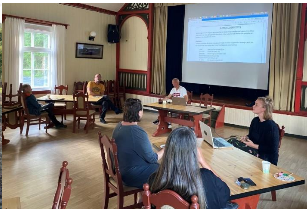
Årsmøtet 2020.