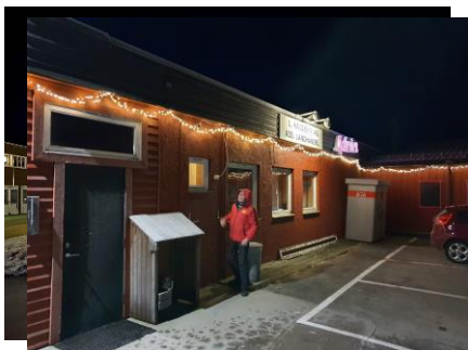
Rigging av julegata.