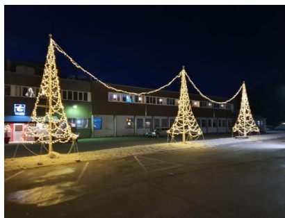
Julegata 2020.