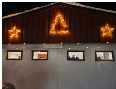
Hett & Svett julepynta.