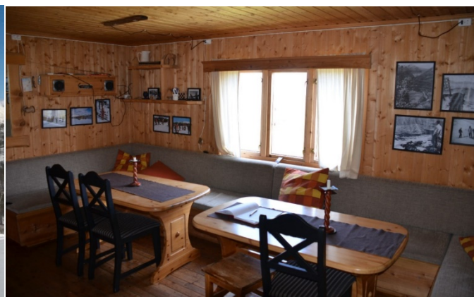
Figur 6 Interiør