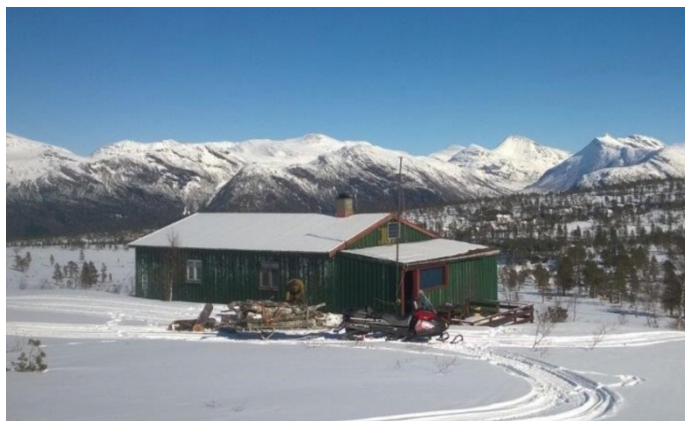
Figur 5 Skihytta Foto todalen.no gjengitt med tillatelse

Neste aksjon for oss er resten av Ytterveggen skal takast i 2022.