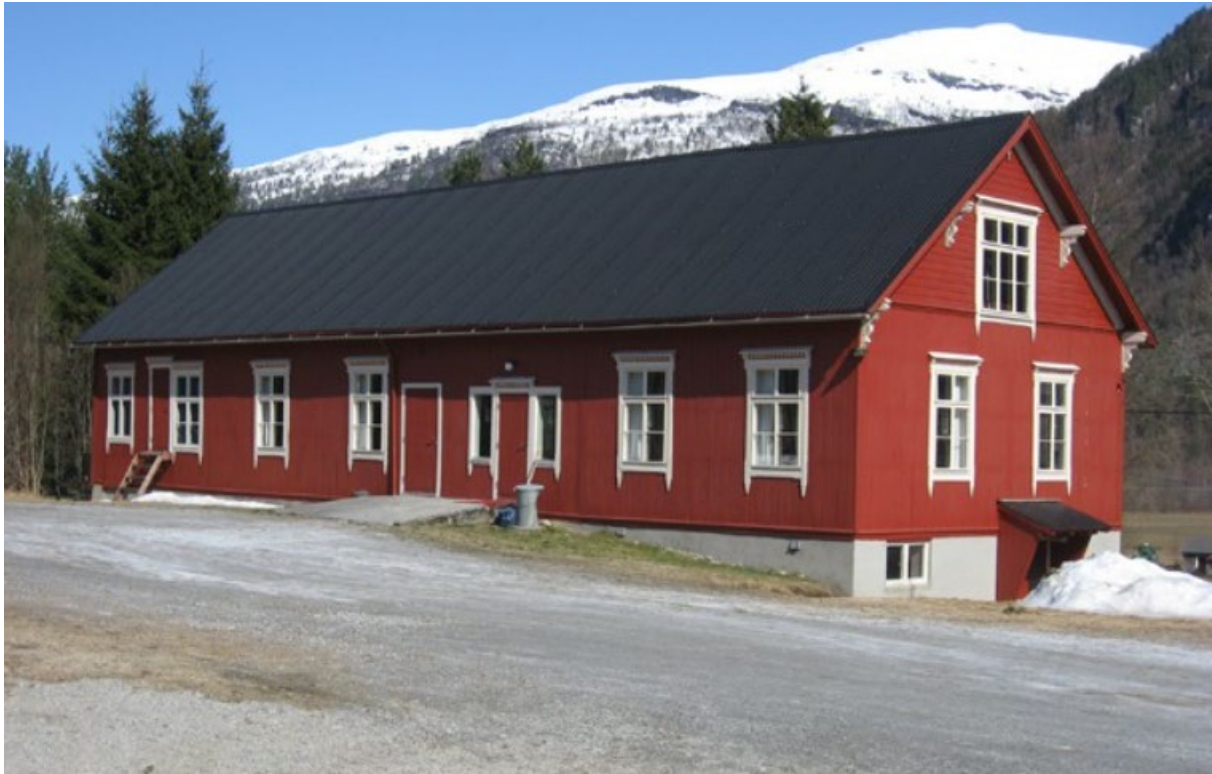
Figur 1 Ungdomshuset