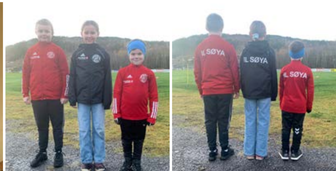
Genser og jakker kan sees og skaffes på Intersport. Pris sort jakke: Junior kr. 389,- / senior kr. 449,-. Klubbgenser: Junior kr. 499,- / senior kr. 599,-. Rød klubbjakke: Junior kr. 639,- / senior kr. 739,-. PS! I tillegg kommer 20% rabatt for våre medlemmer!