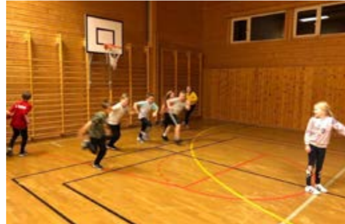
3. og 4. klasse.

I år starta vi opp med barneidrett i uke 43. Det har vært tre grupper fordelt slik: 1. og 2. klasse, 3. og 4. klasse, 5. og 6. klasse (der 7. klasse også får være med om di ønsker). Hver gruppe har holdt på en time kvar, fordelt på tirsdag og onsdag. For de to eldste gruppene har det vært ca 9 barn på hver gruppe, de har hatt litt ulike aktiviteter, som blandet annet stikkball, hinderløype, kanonball, danselek, og ulike stafetter. Vi har i år innført tre enkle regler som barna er flinke til å følge: *vær grei, *hør etter og *være med på det som er bestemt. Det har vært en fartsfylt time med mange glade og svette barn.