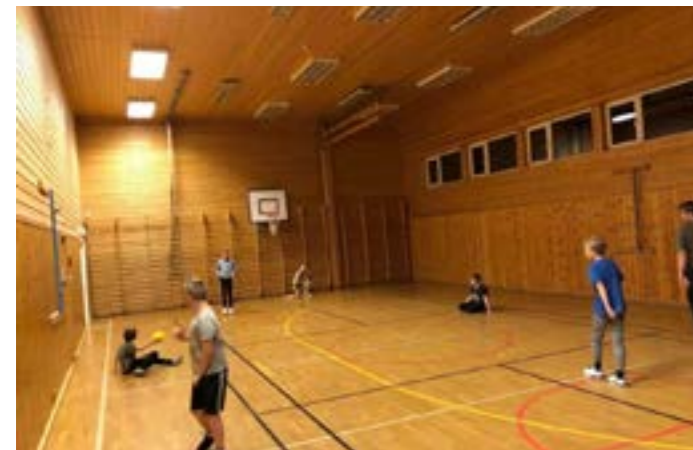
5. og 6. klasse