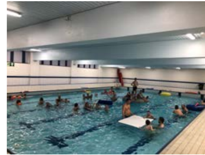
Mange på svømming.