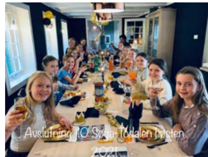
Avslutningsmiddag med høy champagnebrusføring

har vært med stor optimisme. Pandemien har ikke hatt negativ innvirkning på fotballglede og entusiasmen over å få spille fotball igjen - heller tvert imot! Vi har møtt lag som har vært bedre enn oss, jevne lag og vi har også fått kjent på rusen av å være det laget som greide å få flest mål. Trenerteamet har løst oppgaven på en veldig god måte og de kan samtidig melde om god progresjon som lag.