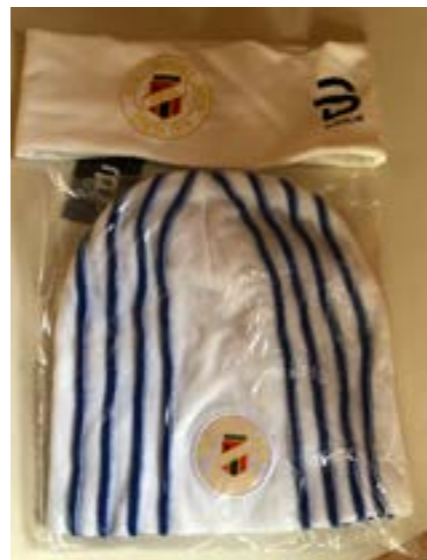
Luer kan kjøpes i skihuset