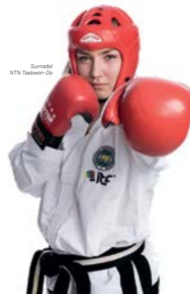
Surnadal NTN Taekwon-Do