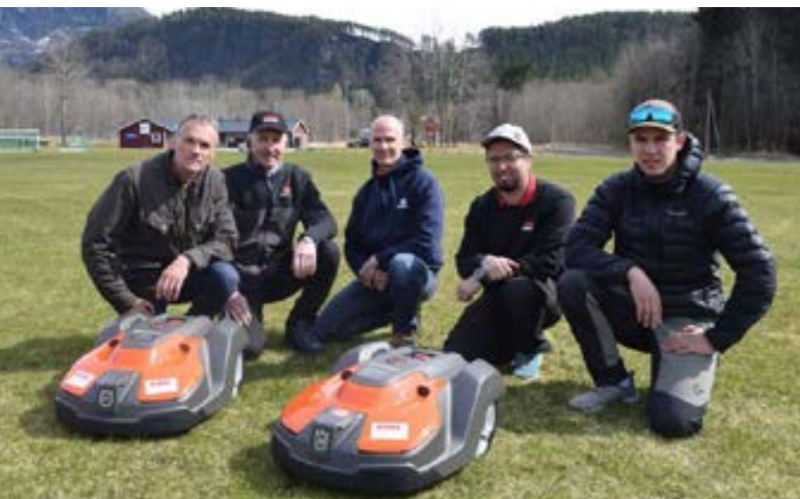
i Driva