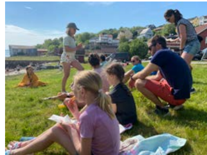
Solfylt dag i Kristiansund

Med en forsiktig start og fravær av fotballaktiviteter på grunn av pandemien ser vi tilbake på sesongen som