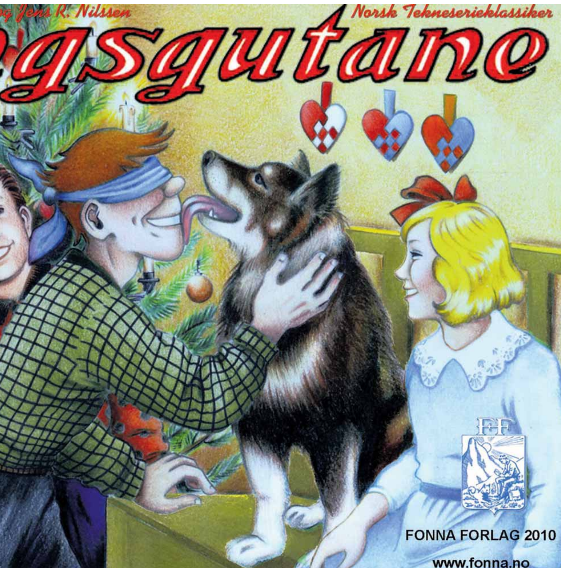
sitt til Vangsgutane i juleheftet for i år.