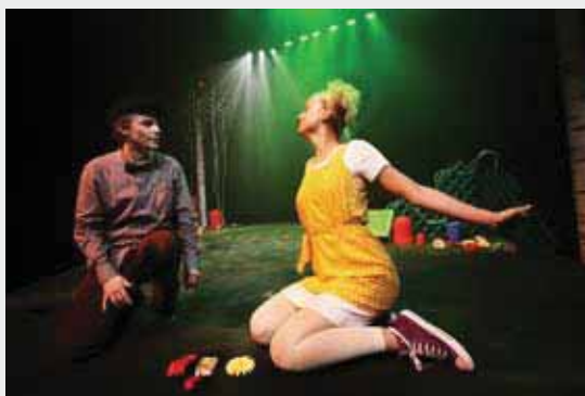
“ALLE DØDE SMÅ DYR”

Salg av billetter i resepsjonen på kulturhuset. Alle dager – 24 t. – Tlf. 71 65 71 00 Kiosken opnar 1 time før forestillingar. – Tlf. 71657108 Billettsalg på nett : www.surnadal-kulturhus.no