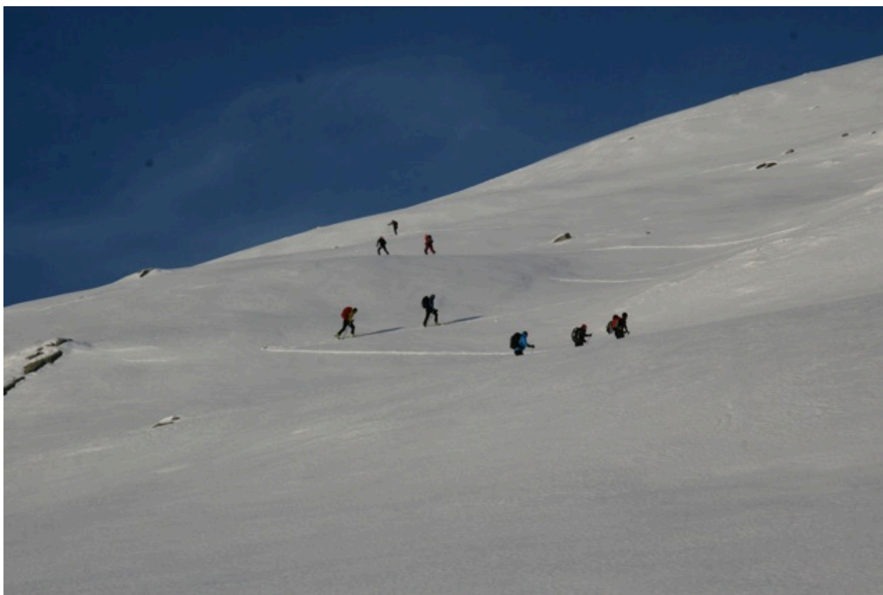
Opp til Vestre Tydalsnebb, 1169 moh.