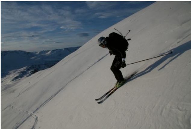
Ned lia fra Vestre Tydalsnebb.