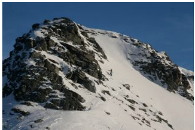
Eggen og renna på Tydalsnebb