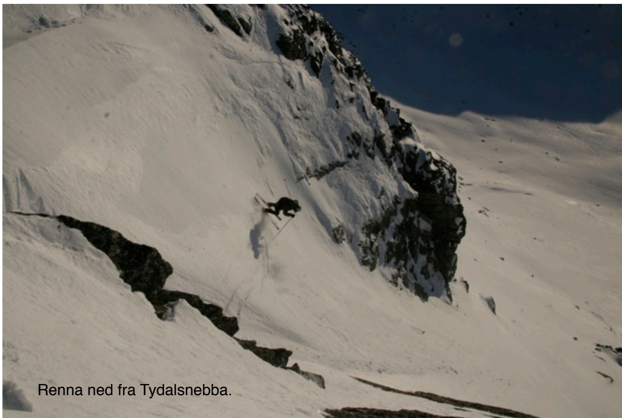
Renna ned fra Tydalsnebb.